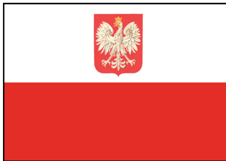
Flaga państwowa z godłem

Jeśli eksponuje się na masztach więcej flag, flagę państwową RP podnosi się (wciąga na maszt) jako pierwszą i opuszcza jako ostatnią.